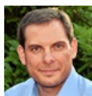
Daniel Schranz, Oberbürgermeister der Stadt Oberhausen

13:00 Uhr Begrüßung durch den Veranstalter und Grußworte des Schirmherrn Daniel Schranz, Oberbürgermeister der Stadt Oberhausen Präsentation des Tagesmoderators